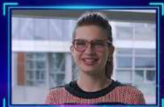
ОЛЬГА учитель будущего