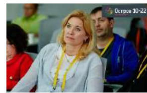
Фокус-группы с учителями