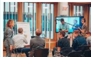
Фокус-группы со школьниками

Учителей фильм мотивирует к эффективной работе с учениками, к изучению тенденций в технологиях и образовании.