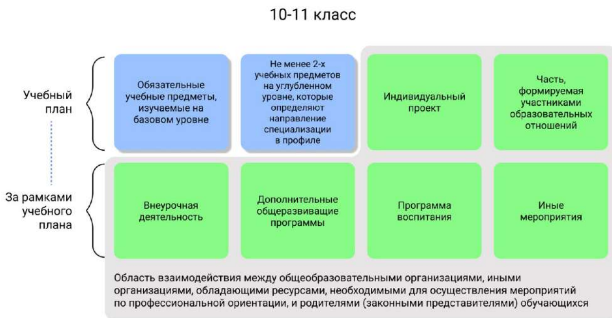
Рисунок 1 – Единая модель профориентации в профильных предпрофессиональных классах – область взаимодействия между общеобразовательными организациями и партнерами

Разработка основной образовательной программы для профильных предпрофессиональных классов проводится с учетом мнения всех категорий участников Единой модели профориентации, представленных на уровне субъекта Российской Федерации, муниципалитета.